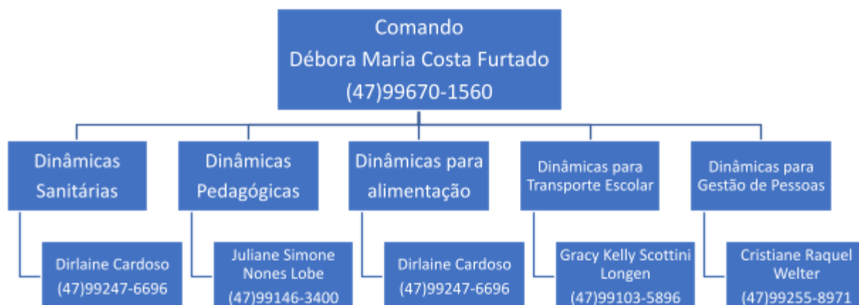
Figura 2: Organograma de um Sistema de Comando Operacional (SCO)

O Núcleo de Educação Raio de Sol adotou a seguinte estrutura de gestão operacional.