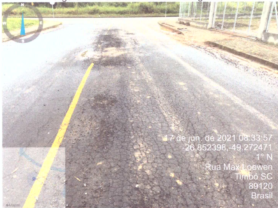
Figura 1 – Painelas e trincas interligadas .